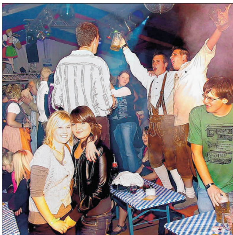
Mit Dirndl und Lederhosen feierten die Gäste beim Jugendclub Heroldstatt.