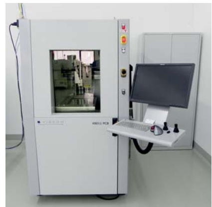
In diesem Jahr neu installiertes Equipment – Beleg der kontinuierlichen Weiterentwicklung